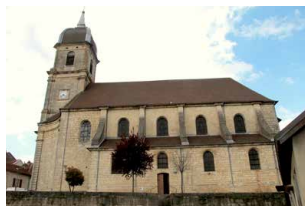
Scey-sur-Saône, église Saint-Martin

La SFA vous accueille sur rendez-vous du lundi au vendredi.