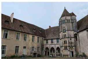
Gy, château des archevêques de Besançon