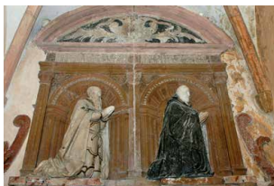
Pesmes, chapelle d'Andelot