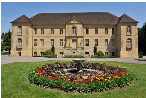
Ancienne abbaye cistercienne de Clairefontaine

Audincourt, église du Sacré-Cœur, église de l'Immaculée Conception ; Ronchamp, église, abri des pèlerins, maison du chapelain