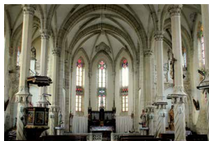
Confrancourt, église Saint-Georges